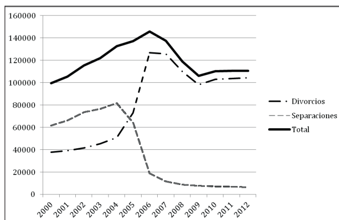
Figura 1. Evolución de las disoluciones matrimoniales 2000-2012.

Fuente: Instituto Nacional de Estadística. Autorizada su reproducción por cortesía del I.N.E.