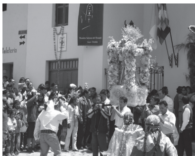
Fotografía B. Cachis adorando ante la Virgen del Rosario

Se puede advertir entonces cómo se despliega una multiplicidad de identidades y comunidades, las cuales se complejizan aún más con el recorrido de los gauchos a caballo, la presencia de canciones patrióticas y el folclor nacional ejecutado en la serenata y el concurso del tamal. Todo ello transcurre por las calles durante las procesiones y frente a la iglesia, centro de la lugar en el que el catolicismo andinos y prehispánicas – partir de contextes –, se suman Y como si esto agrega el “municipal” y “externo”, con industriales que