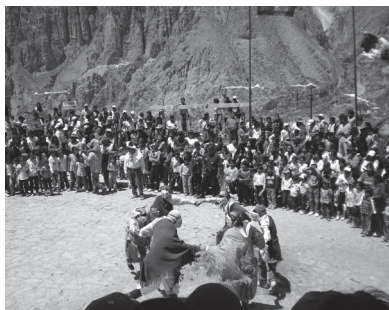
Fotografía F. Familia ejecutando el baile de corneta

Con esta construcción de la alteridad se articulan las perspectivas de los actores sociales locales, quienes valoran y fomentan cierta distintividad mediante las prácticas devocionales, musicales y económicas asociadas al