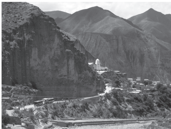
Fotografía A. Vista de Iruya y la iglesia

Acompaña, de esta manera, la construcción simbólica de un lugar caracterizado por un fuerte catolicismo. Las procesiones contribuyen a expandir este catolicismo a lo largo del pueblo; con su paso por las calles, éstas van adquiriendo sacralidad (Colatarci 2008) porque, como dice