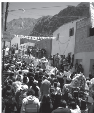
Fotografía C. Procesión por las calles de Iruya

la feria con los artesanales y agropecuarios, y con sus diversas prácticas musicales. Estas últimas son a veces incluidas en el espacio ritual –como la música de Vangelis– y otras veces transcurren por separado, como es el caso del baile popular; pero no por ello dejan de contribuir a la construcción de la distintividad de una Iruya indígena, andina, salteña, argentina, católica, “tradicional” y “moderna”.