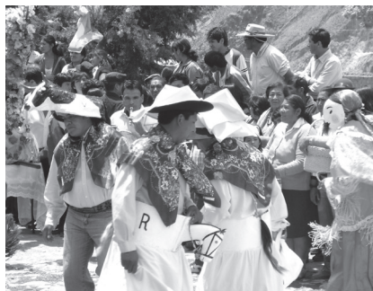
Fotografía G. Caballitos y torito entrecruzándose en la adoración

muchos a veces vienen y dicen 'pero acá han perdido su identidad, porque cómo van a bailar cumbia'; escuchame, no es así, porque nosotros durante todo el año cantamos nuestras coplas, nuestras danzas, y entonces hay un momento que pasa esto, y una vez al mes también pasa eso. Así que todo eso [...] Nosotros seguimos siendo lo que somos, indígenas, y todo lo otro es como un aggiornamento (2008).