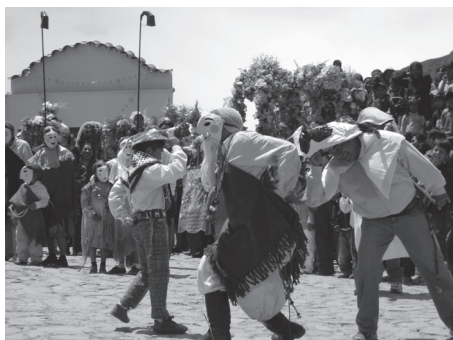
Fotografía E. Cachis grandes y chiquitos: los toritos embistiendo contra el viejo

La Fiesta del Rosario es un evento conformado por actividades muy diversas. Tanto su puesta en escena como las lecturas que los actores realizan de estas actividades hacen referencia, entre otras cosas, a su historia y a las comunidades que integran. La liturgia católica tiene una presencia fundamental en el plano musical, en las misas y las