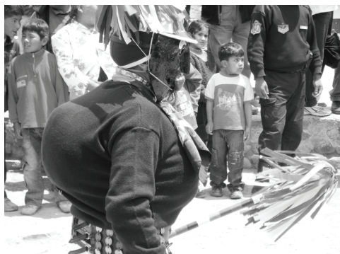
Fotografía D. Cachi negro o rubio

por el otro lado, un imaginario que no las considera entidades excluyentes sino mutuamente imbricadas y formativas. Siguiendo la primera acepción, cabe señalar que se trata de un posicionamiento que posibilita revalorizar sus propias prácticas y saberes, al tiempo que cuestiona la explotación, el despojo y la desestructuración de