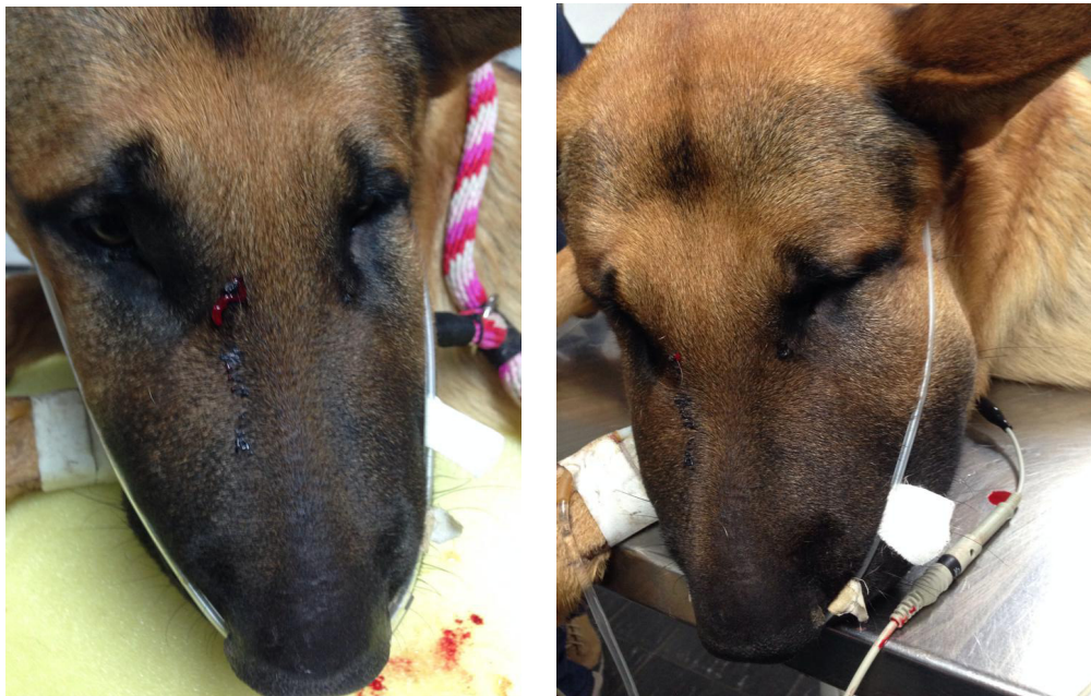
Figura 2. Lugar de la mordedura e inflamación presentada en el paciente.

Es referido a la consulta de la clínica de pequeños animales de la Universidad del Tolima un canino macho de raza Pastor Alemán de 1 año de edad y 35 kg de peso proveniente de la zona rural de la ciudad de Ibagué con reporte de mordedura de serpiente en la región infraorbital derecha (Figura 2) ocurrida aproximadamente 12 horas antes de la consulta. El propietario refiere que el perro presenta salivación, vómito y náuseas. La serpiente que mordió al perro fue capturada, sacrificada y clasificada como una B. asper , la cual de acuerdo a la descripción y el registro fotográfico traído por el propietario del paciente se podría describir como un animal adulto capaz de suministrar una mordida potencialmente letal debido a su tamaño mayor a un metro 19 . No se reporta ningún tratamiento previo a la consulta.