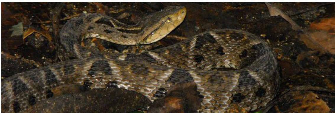
Figura 1. Ejemplar de Bothrops asper .

La incidencia de mordeduras de serpientes, es variable entre países y dentro de un mismo país entre regiones, dependiendo de diversos factores como el clima, los parámetros ecológicos, biodiversidad, distribución de las serpientes venenosas, densidad poblacional humana, actividades económicas entre otras. En América Latina esta incidencia se estima entre 5 a 62 casos/100.000 habitantes por año, dependiendo del país, estimando un promedio de 2.300 muertes por año 19 . La mayor cantidad de casos de mordeduras de serpientes son causados por la especie Bothrops asper (Figura 1), la cual es la responsable del 50 al 80% de las mordeduras