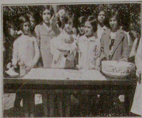
I — Alunas ocupadas na pesagem do bebê