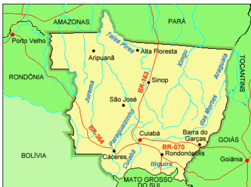
Figura 1 – Mapa do estado de Mato Grosso.

A cidade de Sinop foi fruto desta política de integração nacional. Nasceu a partir de um projeto de colonização privada empreendido pela empresa Colonizadora Sinop S. A. 2 , proprietária de uma extensa área na região norte de Mato Grosso, denominada Gleba Celeste, a 500 km da capital Cuiabá, no município de Chapada dos Guimarães, conforme Portaria do INCRA Nº 1.553/1972 3 . Nesta área foram construídas quatro cidades: Vera, Sinop, Santa Carmem e Cláudia (STRAUB, 2015).