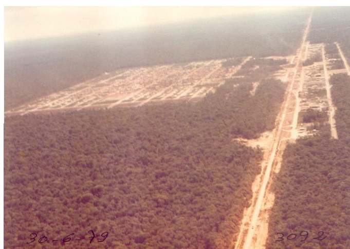
Figura 3 - Vista aérea de Sinop.