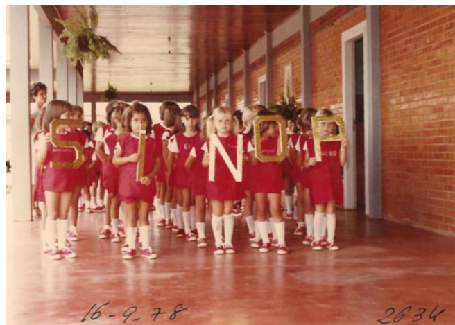
Figura 6 - Alunos da Pré-Escola em homenagens à Sinop.