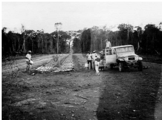
Figura 2 - Abertura da avenida principal da cidade de Sinop.

em 1973, sendo a escola uma extensão da Escola Estadual Nossa Senhora do Perpétuo Socorro de Vera. Oficialmente a cidade de Sinop foi fundada no ano seguinte, em 14 de setembro de 1974 e, em 17 de dezembro de 1979, passou, então, a município. Nas imagens a seguir temos a abertura da cidade em 1972 e uma foto de toda a cidade em 1979.