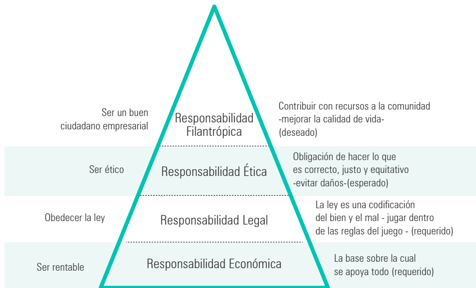
Figura 1. Pirámide de la RSE.

Fuente: Adaptada de Carroll (1991) y Nalband & Kelabi (2014).