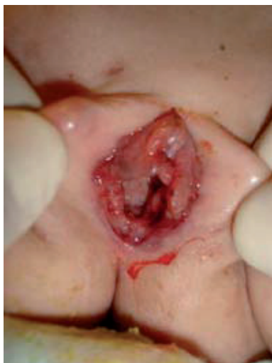
Figura 1. Lesión de tuberculosis en vulva y vagina, similar a procesos malignos.