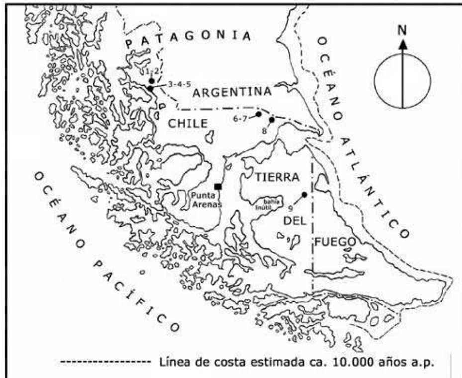
Figura 1: Ubicación de los principales sitios tempranos de interés arqueológico y paleontológico de Magallanes, referidos en el texto: (1) Lago Sofía 1, (2) Lago Sofía 4, (3) Cueva Dos Herraduras, (4) Cueva del Milodón, (5) Cueva del Medio, (6) Cueva Fell, (7) Cerro Sota, (8) Pali Aike, (9) Tres Arroyos.

En Cueva Fell diferenció claramente cinco períodos culturales indígenas previos al contacto con los europeos y un período histórico más reciente. Los restos culturales más profundos de la Cueva de Fell permitieron al autor definir su primer período dentro de la secuencia cultural propuesta.