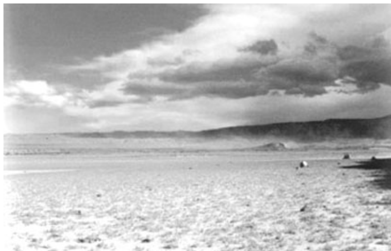
Figura 2. Sector Entrada Baker y Laguna Salitrosa.