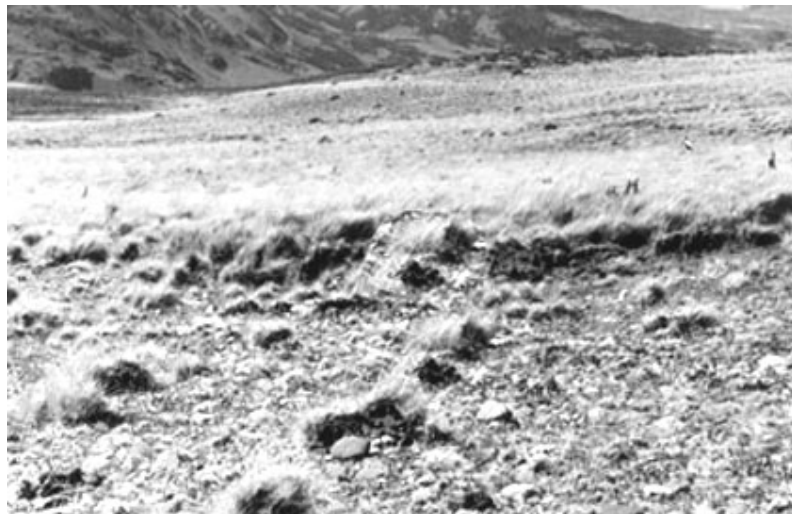
Figura 4. Distribución superficial de artefactos sector oeste (sitio 7S/3 entrada Baker).

La prospección sistemática de la zona de Entrada Baker (sector oeste) no sólo ha confirmado la total ausencia de estructuras funerarias en el área, sino que ha permitido el registro de más de 80 concentraciones líticas ( Figura 4 ) y hallazgos aislados en superficie, que corresponden a breves campamentos o lugares de caza/procesamiento primario y que parecen corresponder en líneas generales a este mismo período Tardío. Como observan Méndez et al. (2003), las materias primas representadas en estos conjuntos son las mismas observadas en los sitios del sector Lago Posadas/Salitroso. La excavación del Alero Entrada Baker, a mediados de la década de 1980, entregó fragmentos cerámicos -inexistentes en el sitio, aparentemente más temprano, de Cerro de Los Indios en el Lago Posadas-; iguales a los registrados en los campamentos asignables a los chenques de Lago Salitroso, e incluso se postuló entonces para ese sitio, una estrategia de "equipamiento" de puntas asociado a revisitas programadas para caza de guanacos ( Mena y Jackson 1991 ). Asimismo, las prospecciones y sondeos de este trabajo de campo en el sector Río Chacabuco, área de bosque, arrojaron resultados negativos en cuanto a la presencia de chenques .