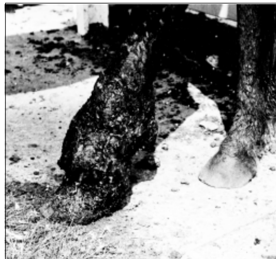
Figura 1 – Eqüino com lesão granulomatosa ulcerada na região metatarso falangeana esquerda.

Todos os animais apresentavam lesões cutâneas localizadas, principalmente nas porções distais dos membros pélvicos, região metatarso-falangeana (Figura 1). Dois eqüinos apresentavam lesão na pele sobre o esterno. As dimensões das lesões variavam de 7 a 30cm de diâmetro, com características granulomatosas, ulceradas, com bordas edemaciadas e irregulares, cobertas por exsudato sero-hemorrágico. Ao corte, havia abundante tecido conjuntivo fibroso de consistência firme e brancacento, entrecortado por galerias cheias de material necrótico amarelado e que