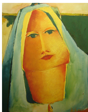
Figura.03 (55x45,5cm, 1977)