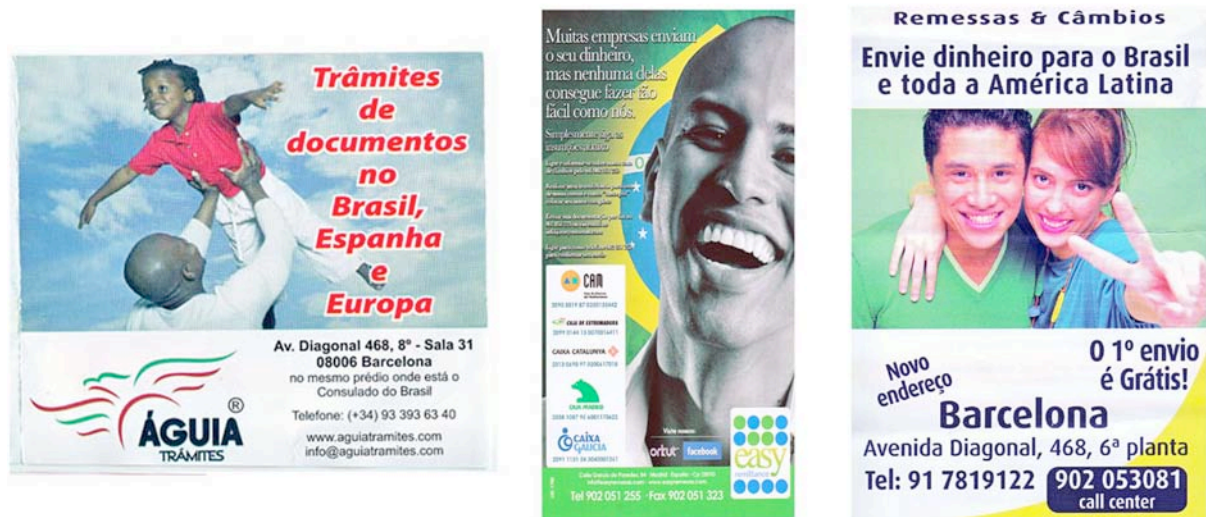
Imagen 01 – Publicidad de empresas de gestión de tramites de documentos ubicadas próximas al Consulado del Brasil en Barcelona.

Pero no sólo Maria Rita, o mejor dicho su música, me acompañó durante aquellos meses en los que preparaba mi viaje; también escuchaba tratando de entender las letras de canciones de João Gilberto o Rita Lee en clase de portugués en el Centro Cultural de Brasil en Barcelona. Aprender portugués desde las lenguas que dominaba, en mi caso español y catalán, me llevaba a comprender gran parte de lo que leía y escuchaba por su similitud y cercanía. Pero pronto aprendí que había ‘falsos amigos’ entre la lengua que empezaba conocer y aquellas que dominaba. ‘Falsos amigos’ son aquellas palabras que, teniendo apariencia similar, poseen diferentes significados; tanto que en ocasiones tienen sentidos contrapuestos.