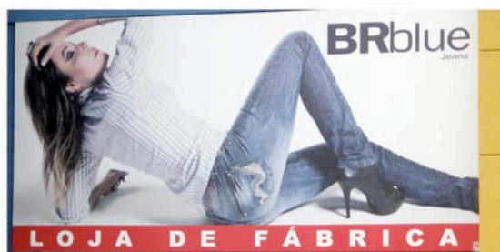
Imagen 02 – Fotografías de publicidad tomadas en la avenida 85 en la ciudad de Goiânia.

Hubo momentos de la experiencia que los y las estudiantes se mostraron inquietos ante las dificultades de asumir nuevos conocimientos, de manera similar a lo que yo experimenté mientras asistía a clase de lengua portuguesa. Suas caras lembravam-me as minhas quando alguém falava-me e não conseguia compreender aquilo que diziam; os seus silêncios iniciais eram os meus quando esgotado procurava concentrado palavras que não encontrava ou tentava conjugar verbos irregulares impossíveis para mim.