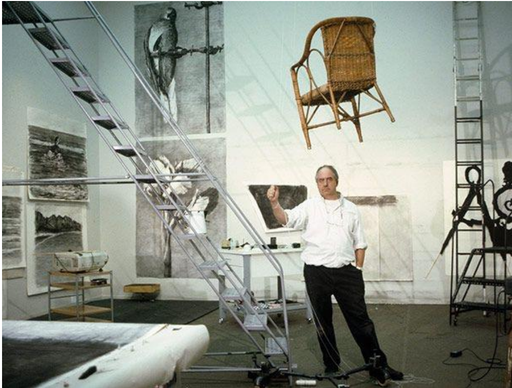
Figura.03: William Kentridge em seu ateliê em Maboneng, antigo gueto que foi revitalizado nos últimos anos em Johannesburg; mostrando como fez a filmagem da cadeira que flutuava. http://bamboonet.com.br/posts/johanesburgo-foi-ressignificada-por-politicas-publicas-investimentos-privados-e-iniciativas-da-populacao-diz-camila-belchior

Na filmagem em que ele e a modelo caminham pelo ateliê, de um lado para o outro, seguindo de encontro a uma cadeira, na qual ele se senta, a cena parece parar o tempo para um registro. Apresenta-se uma lacuna e o tempo de segundos é expandido em minutos. Em outro momento, percebe-se uma cadeira deitada no chão do ateliê, junto a um banco alto de madeira com assento quadrado, que em outra situação já serviu como mesa de apoio. No fundo, o artista se movimenta de um lado para outro buscando encontrar o trabalho. Nessa cena sugere-se uma indiferença ao objeto que, mesmo ignorado, participa indiretamente e contamina-se com as manifestações do artista, que luta pela tentativa de colocar ordem no tempo.