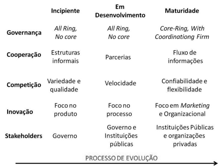
Figura 2: Processo de evolução dos APL de Alimentos e Agroempresas Familiar.