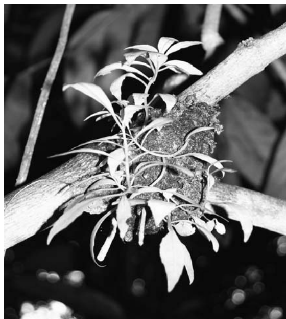
Figura 8: Codonanthe uleana Fritsch en jardín de Azteca sp. en el bosque de terraza.