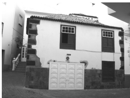
Figura 4. Arquitectura popular canaria. Ejemplo de intervención inadecuada