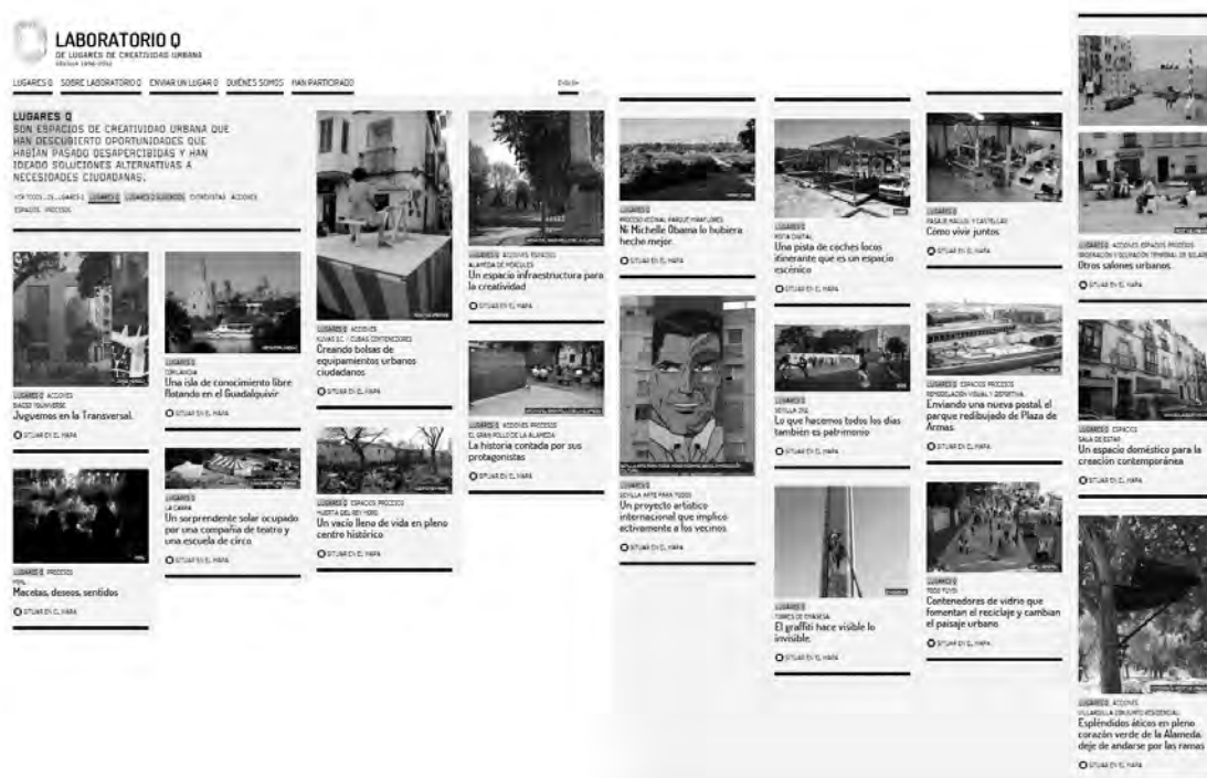
[ 54 ] dearq 16. Julio de 2015. ISSN 2011-3188. E-ISSN 2215-969X. Bogotá, pp. 44-59. http://dearq.uniandes.edu.co

La proliferación de estas organizaciones en los últimos años ha sido inversamente proporcional al avance de la crisis en la disciplina, que sirve de referencia a unos pocos colectivos de mucho más recorrido y significación al resto. Muchas de estas nuevas agrupaciones están alcanzado gran protagonismo y prestigio nacional e internacional como entidad, y quedan en muchas ocasiones en un segundo plano sus proyectos o acciones.