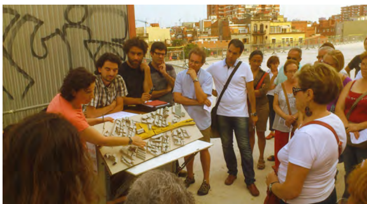
Utilización del Carrito en el proyecto de definición de usos de la cobertura de las vías de tren en el Barrio de Sants, Barcelona, 2013.