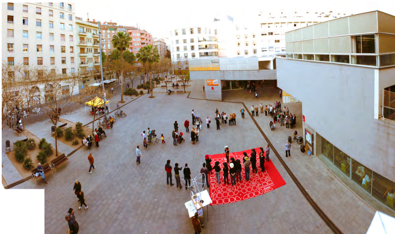
Diagnóstico urbano en el barrio de Fort Pienc, Barcelona, 2011.