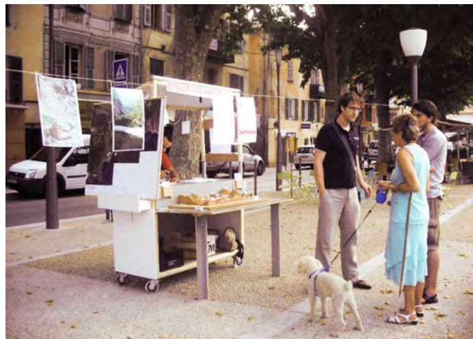
Salidas del Carrito en torno al Woekshop en Sospel, Côte-d'Azur, Francia, 2010.