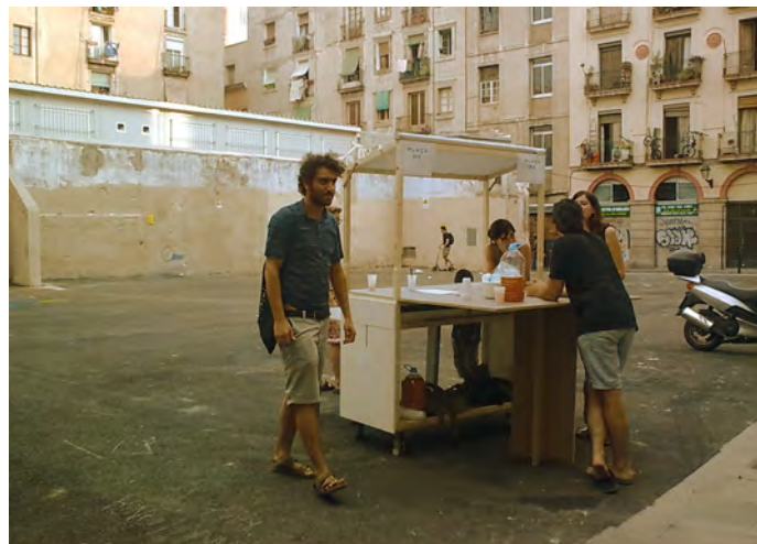
Actividad pon nombre a la plaza, Solar en el barrio del Raval, Barcelona, 2010.