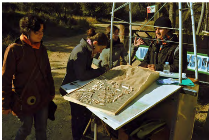
Acción con motivo al concurso de las Puertas de Collserola, Barcelona, 2012.