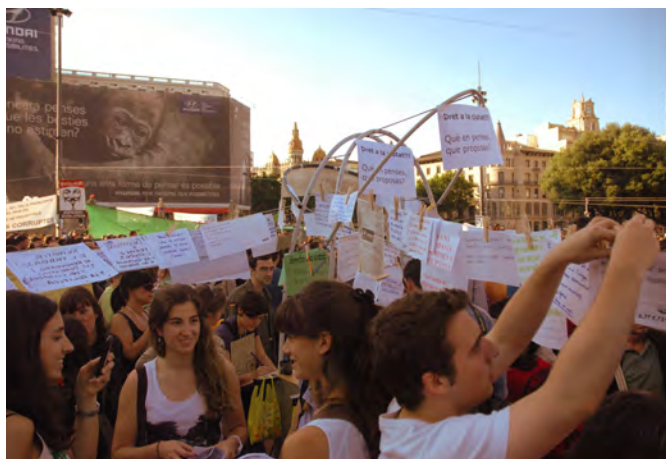
En la Plaça de Catalunya dentro de las movilizaciones del 15M, 2011, Barcelona.