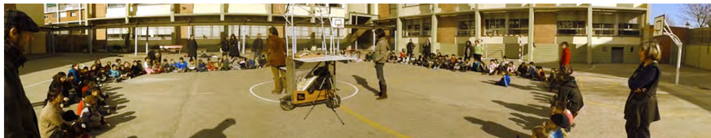
Presentación del proyecto Pati La Pau en la Escuela La Pau, Barcelona, 2011.