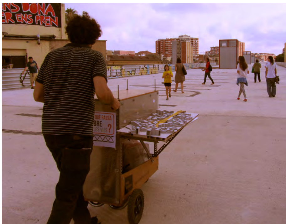
Utilización del Carrito en el proyecto de definición de usos de la cobertura de las vías de tren en el Barrio de Sants, Barcelona, 2013.