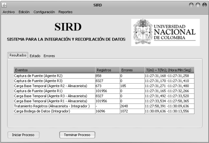
Fig. 3. Resultados del prototipo en el caso de prueba.

Donde, Ttransformacion : duración total de las operaciones de transformación de los registros que serán almacenados en la bodega de datos, y TcargaBD : duración total de la de registros a la bodega de datos. Teniendo en cuenta los datos que se muestran en la Fig. 3, donde se compilan algunos resultados de interés de la ejecución del prototipo para el caso de estudio, se presentan a continuación los resultados para los indicadores definidos previamente.