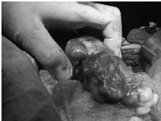
Figura 4. Tumor inflamatorio en colon sigmoides

El paciente presentó buena evolución y fue dado de alta a los 7 días. Hasta la fecha con 2 años de seguimiento, presenta óptimo estado de salud.