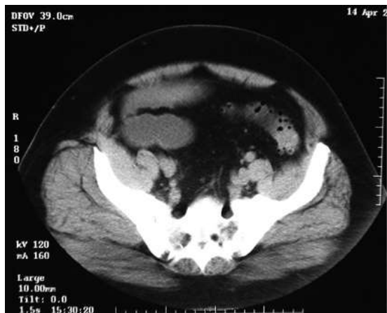
Figura 3. TAC de abdomen: presencia de divertículos en colon sigmoides.

Debido al cuadro clínico, examen físico del paciente, hallazgos de imagen y con la sospecha de oclusión intestinal intermitente por adherencias, se realiza inicialmente tratamiento médico con SNG, antibióticos, analgésicos, control del medio interno y de la volemia; el paciente durante las primeras 36 hrs presenta mejoría con disminución de dolor, eliminación de gases y disminución del débito y mejoría de las características del líquido de la SNG, descenso de la leucocitosis. Posteriormente, el paciente presentó nuevo episodio de dolor abdominal cólico, de aparición súbita, y distensión abdominal. En el examen físico se encuentran signos peritoneales generalizados y ruidos hidroaéreos de lucha. Se decide tratamiento quirúrgico: laparotomía exploradora, incisión mediana supra e infraumbilical en la cual se objetiva asas de intestino delgado dilatadas con líquido en su interior, no se hayan adherencias ni tumoraciones en intestino delgado. En el cuadrante superior derecho se visualiza importante proceso inflamatorio adherencial. Al examen del colon, éste presenta buena vitalidad, con leve distensión, encontrando el sigmoides inflamado con paredes edematosas y tumoración intraluminal de forma cilíndrica de 4 cm de diámetro, dura y fija (Figura 4).