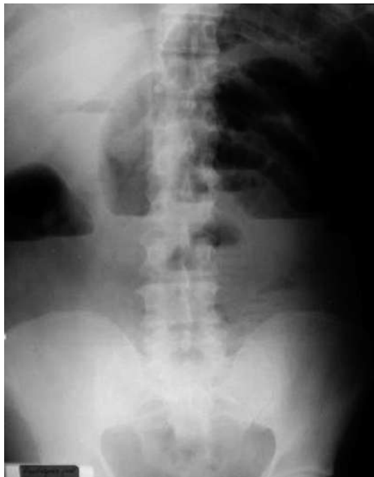
Figura 1. Rx de Abdomen

calibre de la pared a nivel del ileon próximo a la válvula ileocecal (Figura 2). Colon de calibre disminuido a nivel del sigmoides, con divertículos. Sin líquido libre intraperitoneal (Figura 3).