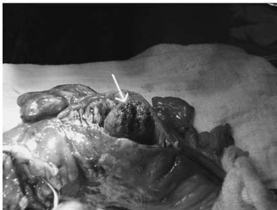
Figura 5. Apertura de colon sigmoides en donde se aprecia cálculo biliar (flecha blanca).