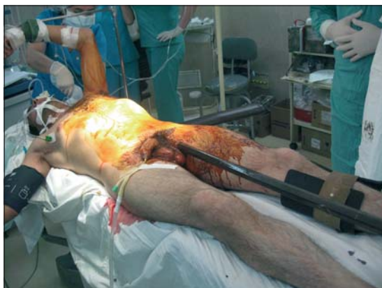
Figura 1. Sitio de entrada.

citan exámenes de laboratorio pertinentes, tomografía computarizada (TC) de Tórax, Abdomen y Pelvis, que mostró indemnidad de grandes vasos; lo que fue corroborado por ecotomografía, dada la interferencia del estudio tomográfico por el cuerpo extraño. Se indica cirugía de urgencia, realizando toracofrenolaparotomía paramediana izquierda amplia (Figura 3), encontrando lesión pulmonar en lóbulo inferior izquierdo transfixiante con hemoneumotórax de escasa cuantía, lesión diafragmática (Figura 4), cinco heridas transfixiantes de intestino delgado con lesión de sus mesos, y fractura expuesta de arco posterior de segunda costilla y escápula izquierda. Se extrae elemento traumático bajo visión directa realizando: neumorrafia, frenorrafia, reparación de lesiones intestinales con sus mesos, además de aseo quirúrgico de las fracturas. Finalmente, se realiza aseo prolijo de la cavidad abdominal y pleurotomía a caída libre. Se indica además aporte de volumen, analgesia y antibioticoterapia.