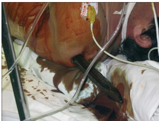
Figura 2. Sitio de salida.