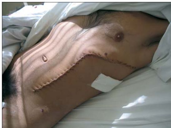
Figura 5. Incisión cerrada.

Realiza su postoperatorio en UCI evolucionando con estabilidad hemodinámica, conectado a ventilación mecánica las primeras 24 horas. Se traslada a sala de cirugía evolucionando satisfactoriamente, con herida operatoria en buenas condiciones (Figura 5), por lo que se otorga el alta luego de completar 10 días de tratamiento antibiótico, con indicación de control en su consultorio en una semana y control en policlínico de cirugía en un mes.