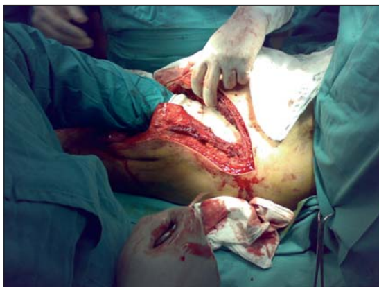
Figura 3. Toracofrenolaparotomía.