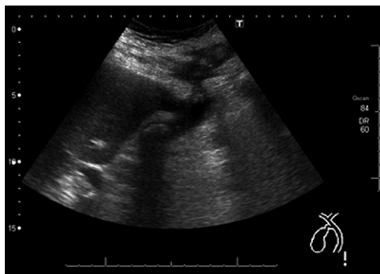
Figura 1. Ecografía donde se muestra el trayecto fistuloso.