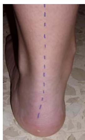
Figura 1: Marcación del ATC

tomada al 50% de la longitud real del pie (desde la parte más posterior del calcáneo hasta la parte final del dedo más largo).