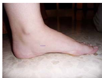
Figura 2: marcación del escafoides por palpación

-La medición de la altura del escafoides a través de la palpación directa (Figura 2), como describen Chu, et al. (1995) y Saltzman, Nawoczenski y Talbot (1995), tiene también sus ventajas e inconvenientes. Dentro de las ventajas estarían que es un método rápido de usar, sencillo y no presenta ningún tipo de riesgo para los participantes. En cambio, los inconvenientes son que es un método subjetivo, ya que se realiza