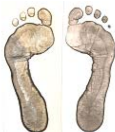
Figura 5. Resultado final de la imagen