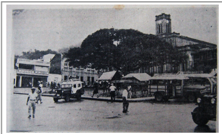
Plaza Principal años 60's.