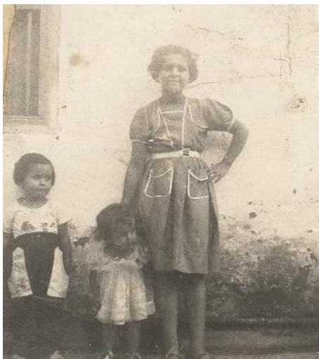
Madre soltera de Fredonia junto a sus dos hijas

N. de A.: Fotografía donada por la familia Toro Calle.