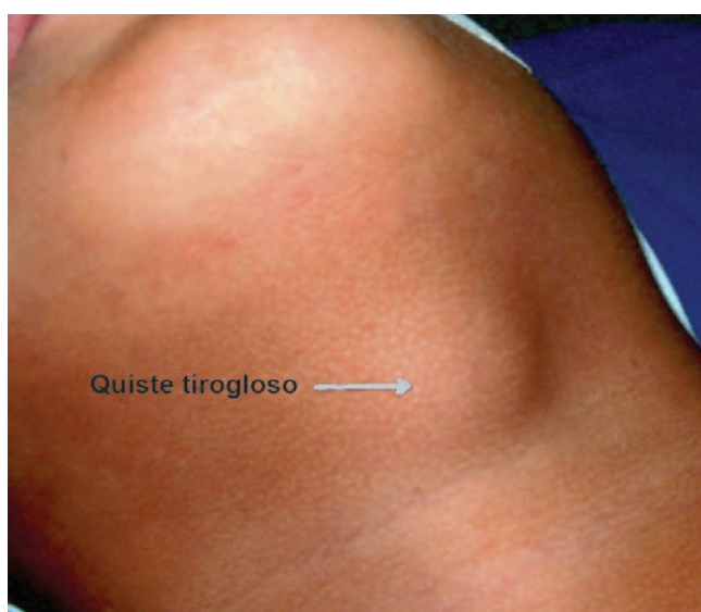
FIGURA 1. Quiste del conducto tirogloso

No cabe duda de que el tratamiento estándar para el quiste del conducto tirogloso es la resección quirúrgica y clásicamente se ha recomendado la remoción del quiste mediante el procedimiento de Sistrunk 10-12 , en el que se extrae el cuerpo del hueso hioides y un segmento muscular adyacente 13 . Según lo reportado en la literatura científica, el obviar la resección de la porción central del hueso hioides genera una recurrencia hasta de 10 % 12 .