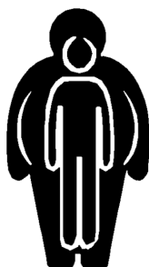
FIGURA 1. Mecanismos fisiopatológicos asociados a enfermedad por reflujo gastroesofágico en obesidad y manga gástrica.