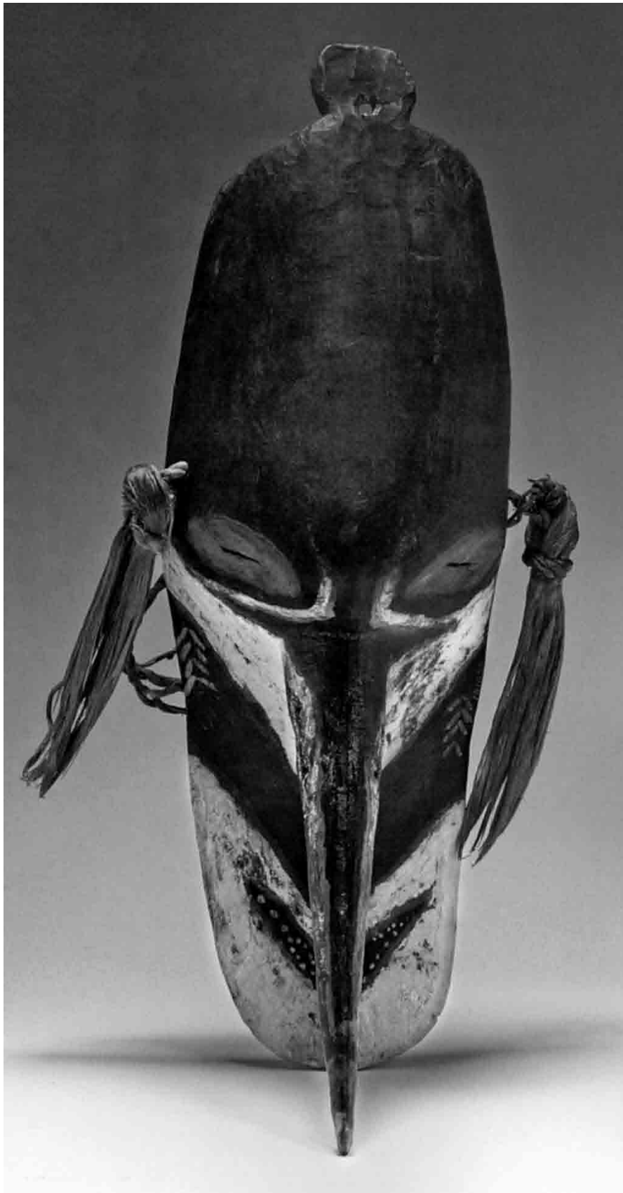
FIGURA 2. Máscara Espíritu, Isla de Mushu, Provincia del Sepik Oriental, Papúa Nueva Guinea Exposición Moana. Culturas de las islas del Pacífico (Colección Museo Nacional de las Culturas, INAH, fuente: Mondragón 2010: 195).

funcionaron como una coherente estrategia mercadotécnica, al ser reproducidos en varios tipos de souvenirs –llaveros, cuaderno de notas, etcétera– que están a la venta en la tienda de la exposición.