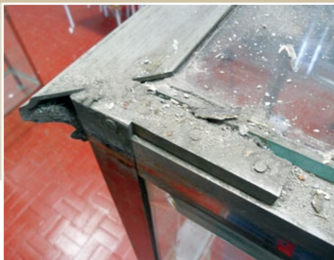
FIGURA 5. Estructura metálica corroída.