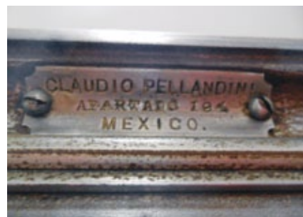
FIGURA 3. Troquelado metálico que registra datos de factura de las vitrinas.

superficies presentaba concentraciones de polvo, partículas contaminantes de todo tipo, restos orgánicos (cadáveres de insectos), manchas y pedazos de cintas adhesivas (Figura 4). Notablemente, las estructuras metálicas en su totalidad, por su propia