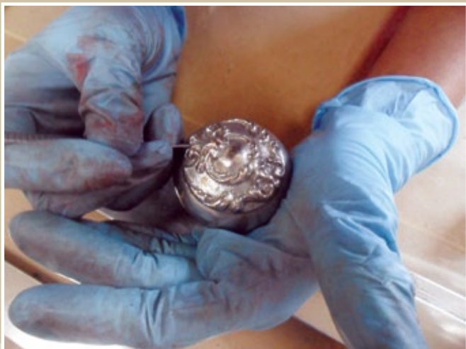
◀ FIGURA 6. Intervención en detalles estéticos de una de las vitrinas: perilla.