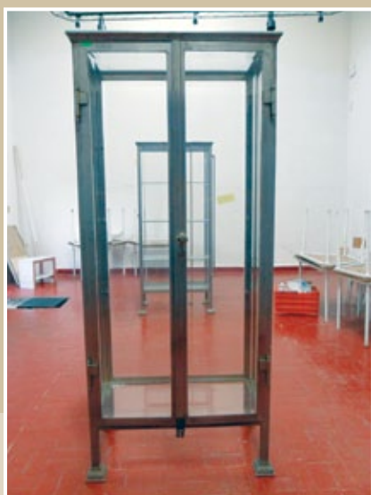
FIGURA 1. Vista general de una de las vitrinas en su estado en 2011.

parte de sus colecciones en varios museos nacionales del INAH 3 y otras instituciones museísticas del país.