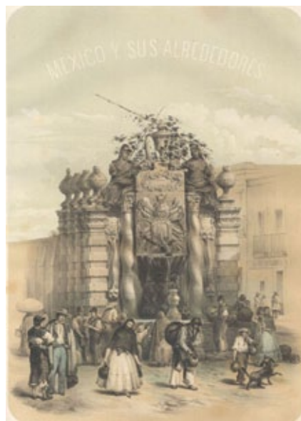
FIGURA 4. Estampa de Casimiro Castro, disponible en [ http://www.luisvives.com/servlet/SirveObras/mex/01472848655794917754480/thm0001.htm ].

La temática costumbrista de los murales de La Moreña ciertamente parece muy alejada de esas tendencias promovidas oficialmente. De hecho, esta singularidad es lo que le confiere un valor especial, ya que su representación deja a un lado los cánones académicos para inspirarse, en cambio, en las mencionadas estampas de Casimiro Castro, un artista que si bien no había egresado de la Academia, ganó fama como cronista pictórico, gracias a la documentación de paisajes y escenas de costumbres mexicanas propias de su época.