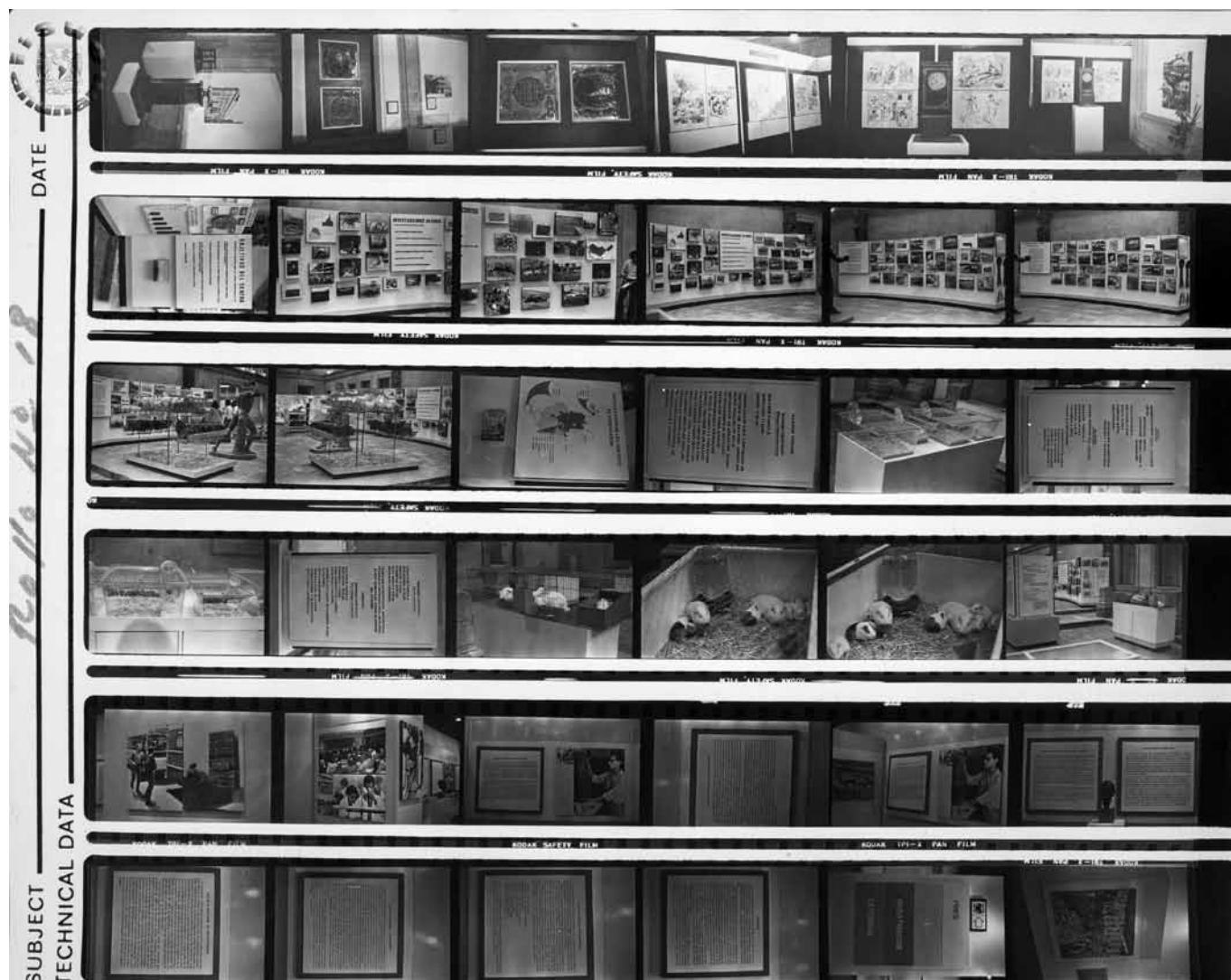
FIGURA 4. Serie de imágenes que registran parte de la exposición.