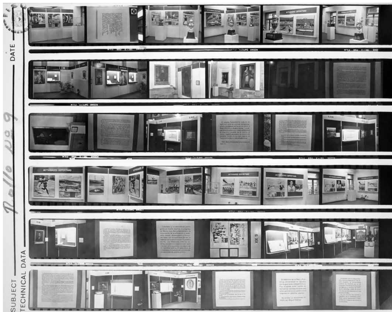
FIGURA 2. Serie de imágenes que registran parte de la exposición.

Dicha colección se nutrió, por ejemplo, con grabados, esculturas y retratos de la Academia de San Carlos, libros incunables mexicanos y diversos ejemplares cuyas primeras ediciones atesora la Biblioteca Nacional, el óleo de Juan de Miranda con el retrato de Sor Juana Inés de la Cruz que custodia Rectoría, la maqueta de Mario Pani de la Torre de Rectoría o el modelo para la Biblioteca Central de Juan O'Gorman. Todo esto ilustra la plena inmersión de la UNAM en la historia, que los visitantes experimentaron al recorrer los pasillos de la Exposición.