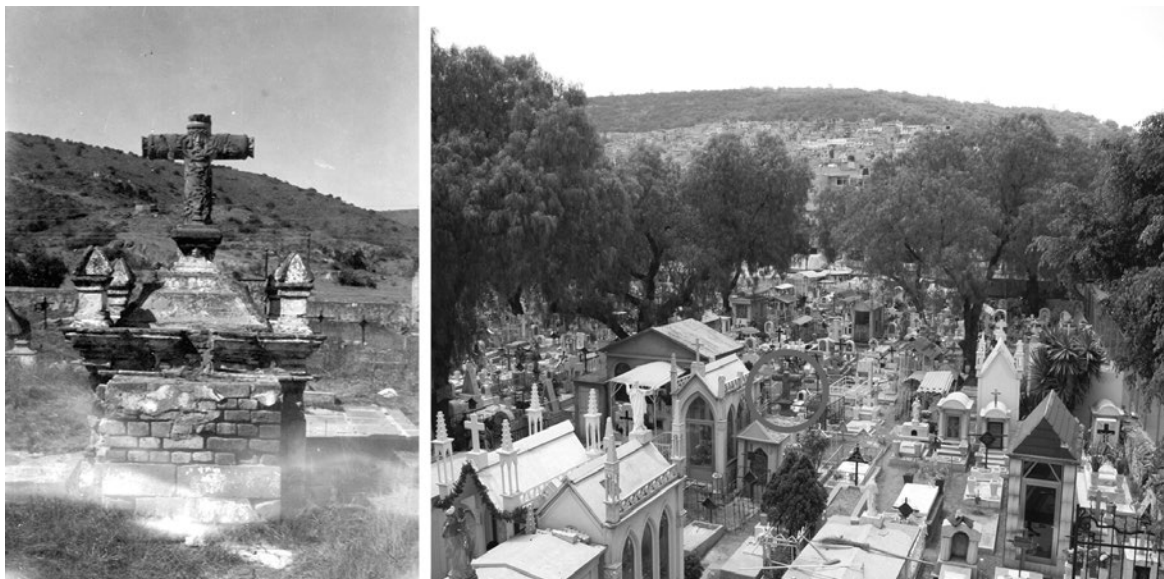
FIGURA 5. Vista del atrio y cruz del conjunto de Santiago Atzacualco, 1932-2013 (Izquierda. Derecha.)