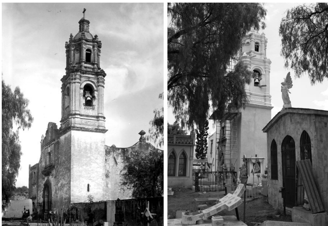
FIGURA 3. Vista lateral de la portada y torre del templo de Santiago Atzacualco, 1932-2013. Se aprecian las diferencias de los monumentos fúnebres antes y ahora (Izquierda. Derecha.).

En la ilustración de una de las letras capitulares que forma parte de los documentos del “Directorio para el Gobierno del Curato de Nuestra Señora de Guadalupe de México y sus quatro pueblos...”, fechado entre 1810 y