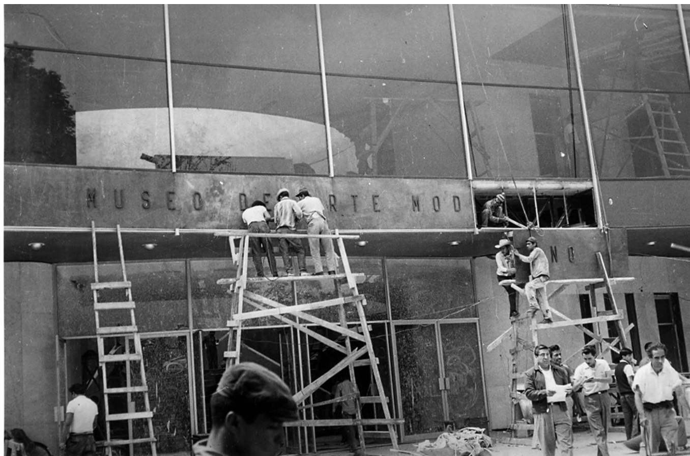
FIGURA 1. Vista de la construcción del Museo de Arte Moderno (MAM), Instituto Nacional del Bellas Artes (INBA), 1964, México.

En el plan inicial de museos que, como parte del programa de educación extraescolar, reforzaría el trabajo en aulas iniciado con el plan de alfabetización nacional, no estaba prevista la construcción del recinto para el arte moderno mexicano (Iannini 1987:56). Narra el arquitecto Pedro Ramírez Vázquez que durante uno de los acostumbrados recorridos dominicales que hacía con Adolfo López Mateos para visitar museos, el presidente preguntó por qué no existía en dicho plan la intención de erigir uno de arte moderno. Como respuesta, el interpelado señaló un descuido del Estado por consolidar un acervo propio de la producción artística contemporánea: si había desinterés por adquirir o pactar donaciones, esta falla subrayaba al mismo tiempo la falta de un sitio en el que colocar dicha colección (Iannini 1987:56). De acuerdo con la versión de Ramírez Vázquez, López Mateos le propuso en ese momento que “rompiera ese círculo vicioso”