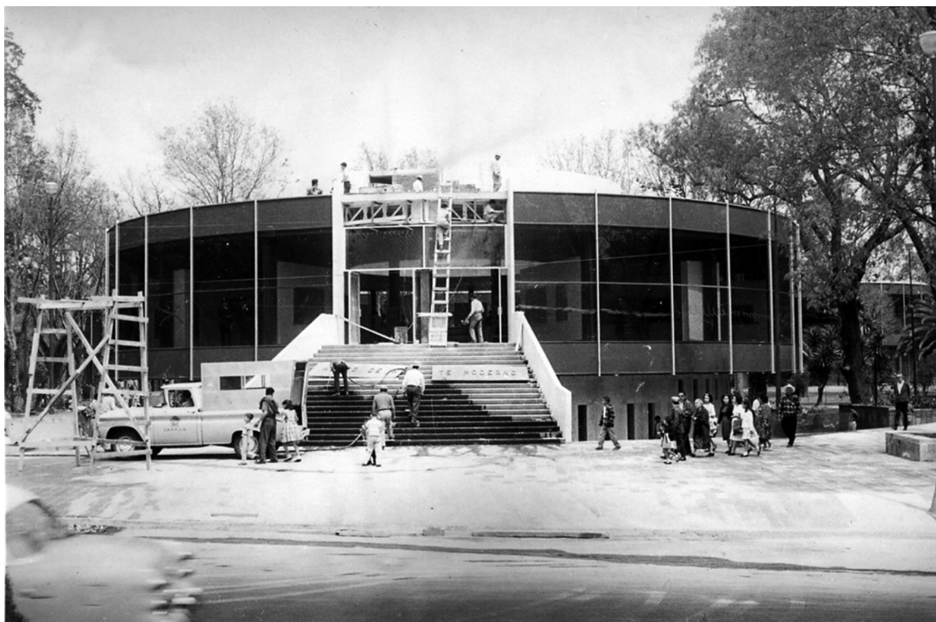
FIGURA 3. El MAM-INBA en proceso de construcción, 1964.

Al descuido de las instituciones culturales por consolidar acervos de arte moderno se aunaba la falta de interés por integrar las tendencias internacionales en el sistema cultural mexicano, lo que era factible en el recién creado MAM-INBA mediante una natural adición a su programación museística, si es que las lógicas culturales vigentes para 1964 realmente buscaban “enriquecer los horizontes en una perspectiva universal, así como estimular el