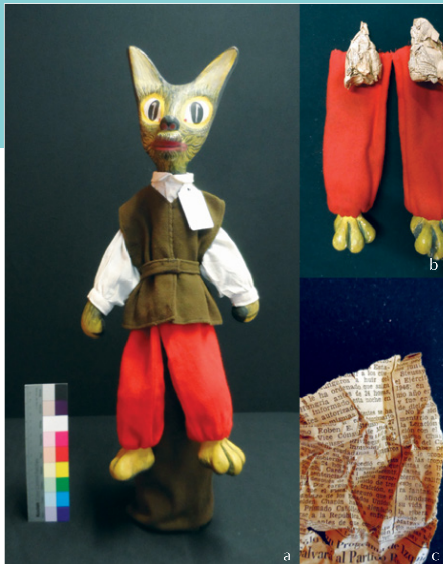
◀ FIGURA 8. Presencia de restos de periódico como relleno en guiñol Inv. 57927, en el cual aparece la fecha de 1946, misma que sirve de datación.