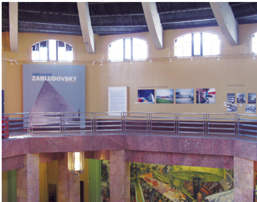
FIGURA 2. Perspectiva de la exposición Abraham Zabludovsky, 1924-2003, en el Museo Nacional de Arquitectura (MNA), Instituto Nacional de Bellas Artes (INBA), México.