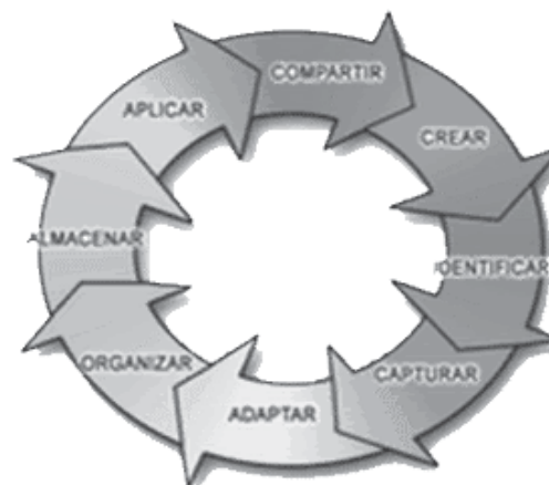
Figura 1 Ciclo del conocimiento

ciendo como algo valioso y se están invirtiendo ingentes cantidades de recursos en las diversas fases del ciclo (ver figura 1) que involucra el conocimiento desde su producción o captura hasta su uso.