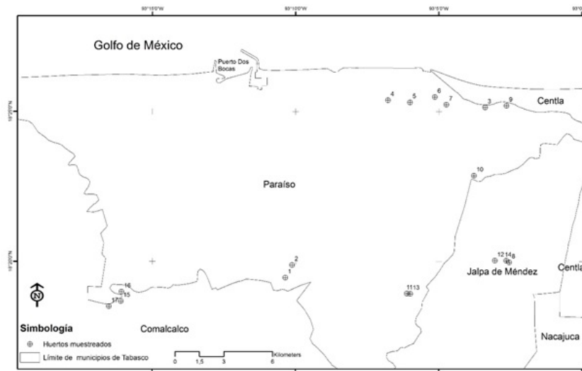
Figura 1. Localización de los huertos familiares de muestreo en la costa de Tabasco, México.

de las capas de 0 a 10, 10 a 20 y 20 a 30 cm de profundidad del pedón, distribuidas sobre el área del huerto y mezcladas por cada capa en un recipiente para obtener una muestra compuesta, a finales de la temporada de lluvias (febrero y marzo), nortes (octubre, noviembre y diciembre), secas (marzo, abril y mayo) y lluvias (junio, julio, agosto y septiembre). Para lo cual se perforó el suelo con una barrena manual y se determinó la profundidad a la que se encontraba el manto freático. Las muestras de suelo se secaron en el laboratorio para luego determinar la CE en una submuestra de 12 g con el equipo multi-paramétrico Hannah modelo HI 9828.