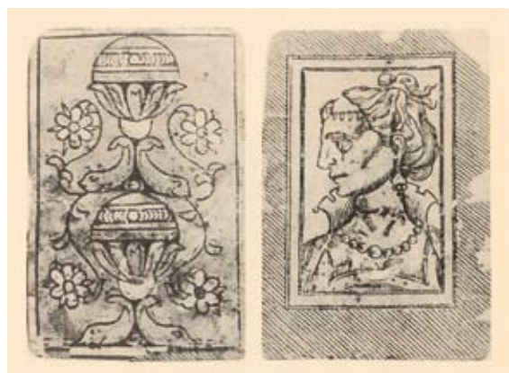
Figura 3. Anverso y reverso de naipe de Huaca 3 Palos (Estabridis Cárdenas 2002: 89).

Hacia mediados del siglo XVIII, el jesuita Florian Paucke (1942-1943) ilustra una sota de diamantes (fig. 5) de las arribadas a América. No deja de llamar la atención la disposición especular de la figura, su tendencia circular