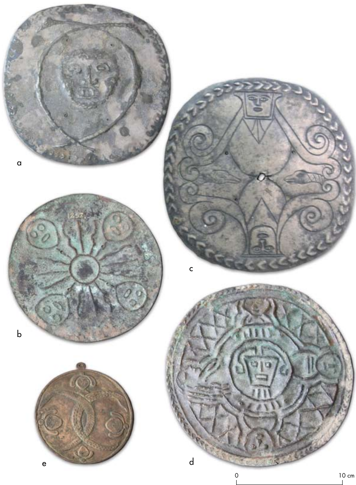
Figura 1. Placas de Tilcara. Figura 1. Tilcara plaques.