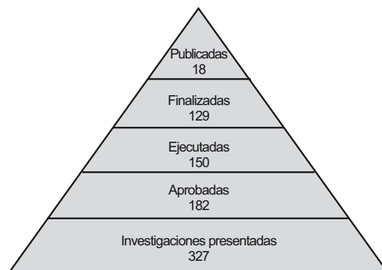
Figura 1. Estado de las investigaciones periodo 2004-2008. Instituto Nacional de Salud

Durante este quinquenio se desarrolló cuatro fondos concursables entre los años 2004 - 2007 (Tabla 1) que