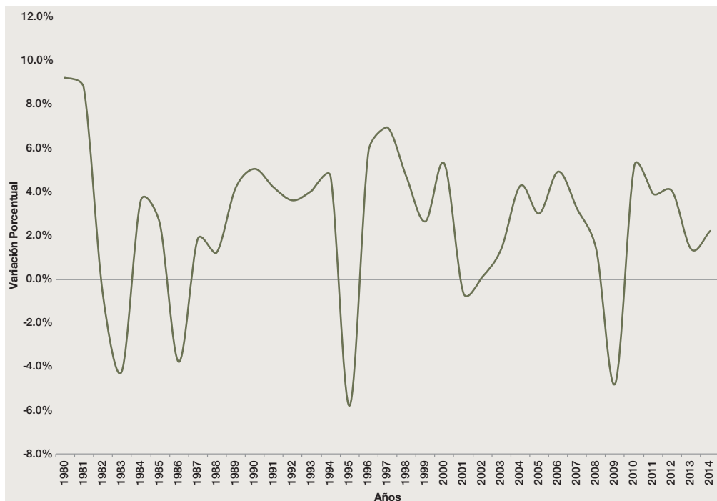
Gráfica 2 México: Variación Anual del PIB de México 1980 - 2014

Fuente: elaboración propia con datos sobre las cuentas nacionales del Banco Mundial.