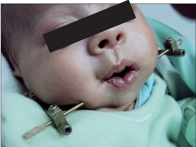
Fig. 4. Distractor colocado. Postoperatorio inmediato y a las 2 semanas que pone en evidencia la distracción.

días siguientes a la interconsulta, previa verificación del estado clínico y evaluación anestésica con una duración promedio de 30 minutos. Las fases de la distracción se cumplieron en todos los pacientes; la activación de 12 días (Fig. 4) y luego la fase de consolidación, se completaron duplicando el tiempo de la fase de activación, siempre sobrecorrigiendo la relación maxila-mandibular