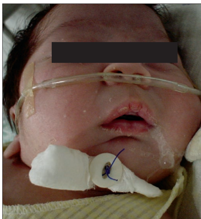
Fig. 1. Fijación lingual al mentón

Seleccionamos aquellos neonatos en los que se solicitó interconsulta a Cirugía Plástica y que cumplieron con los siguientes criterios de inclusión: paciente neonato (1-30 días de edad), que presenta retrognatia, micrognatia o que cumple todos los criterios diagnósticos de Se-