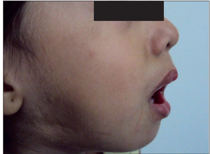
Fig. 8. Caso 3. Pre y postoperatorio a los 3 años en paciente con Secuencia de Pierre Robin aislada.

gica de elección para la resolución definitiva de esta alteración. La relación coste-beneficio y la estancia hospitalaria prolongada teniendo en cuenta las dificultades económicas que presentan nuestros hospitales, convierten a esta alteración en un problema de alto coste tanto para las familias como para el sector salud.