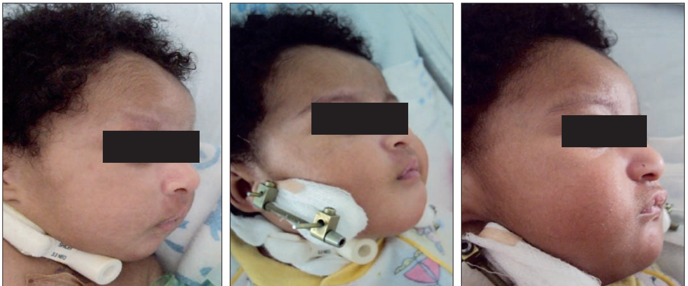
Fig. 6. Caso 1. Preoperatorio, durante la distracción y finalizada la distracción en neonato remitido con traqueotomía.

Las investigaciones previas (3,5,6) acerca de la distracción ósea gradual en la mandíbula han permitido establecer que, si ésta se utiliza en neonatos con apnea del sueño de origen obstructivo, resulta ser la técnica quirúrgica