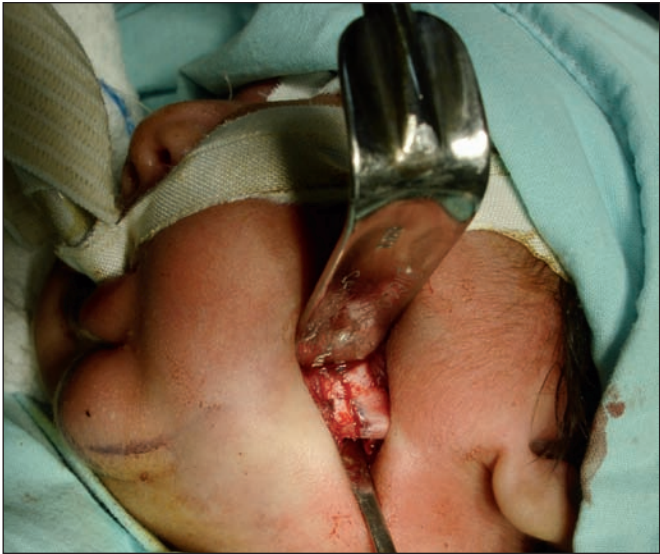
Fig. 3. Corticotomía del ángulo mandibular.