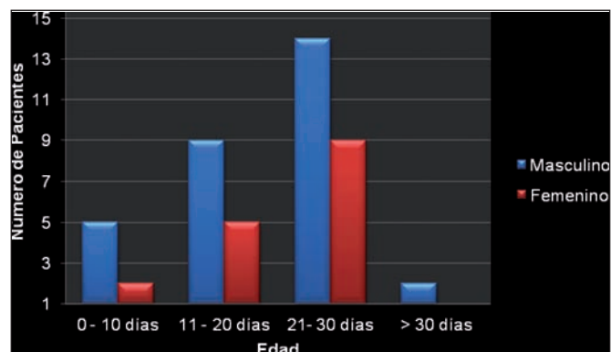
Gráfico 1. Distribución por edad y género. Total 49 pacientes.