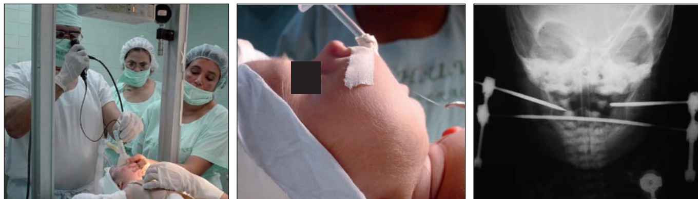
Fig. 2. Intubación con fibroscopio y radiografía de control postoperatorio inmediato.

La intervención quirúrgica se llevó a cabo en los 3