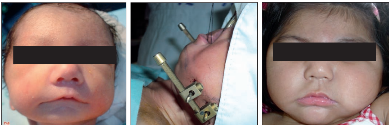
Fig. 7. Caso 2. Pre y postoperatorio inmediato y a los 4 años en paciente con Síndrome de Moebius con Secuencia de Pierre Robin.