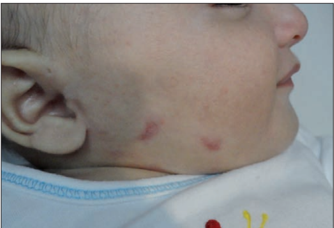
Fig. 5. Final de la distracción. Fase de consolidación con el distractor y sin el distractor con corrección de la retromicrognatia.