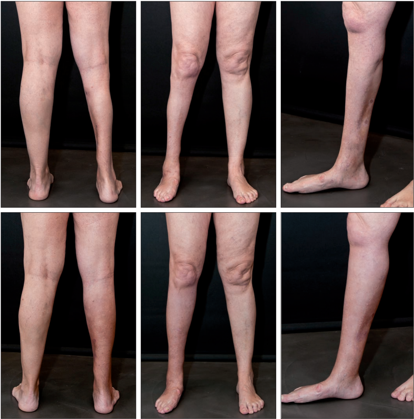
Fig. 2. Caso 2. Imágenes preoperatorias (fila superior) y postoperatorias (fila inferior) 12 meses después de la segunda sesión.

Durante la primera sesión injertamos 26 cc de tejido adiposo, seguidos de 40 cc más a los 8 meses y de 50 cc más