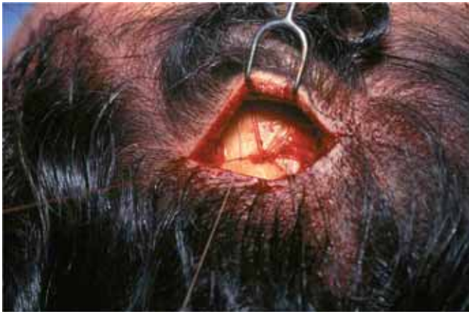
Fig. 4. Anclaje de las suturas al túnel monocortical realizado en el hueso frontal.

de 2 mm introducida diagonalmente hasta observar un pequeño sangrado que indica que hemos llegado a la esponjosa. Enseguida se hace una perforación convergente, calculando que ambas perforaciones se conecten en su extremo interno para establecer un túnel. Debemos calcular que la separación entre ambas perforaciones debe permitir el libre paso de la aguja curva que tienen las suturas atraumáticas. Se pasa la aguja a través del túnel cortical en el hueso frontal y se tensa hasta llevar la ceja a la altura deseada. Se colocan dos o tres puntos similares distribuidos en la zona para asegurar la suspensión (Fig. 5).