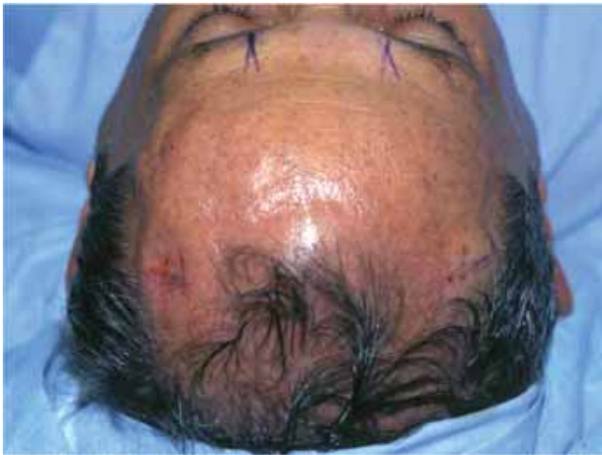
Fig. 1. Planteamiento quirúrgico del abordaje mini-invasivo de la región frontal, ubicación de las incisiones, trayecto de los nervios supraorbitarios y músculos a tratar.

zando este procedimiento, producto de nuestras experiencias y que describiremos a continuación.