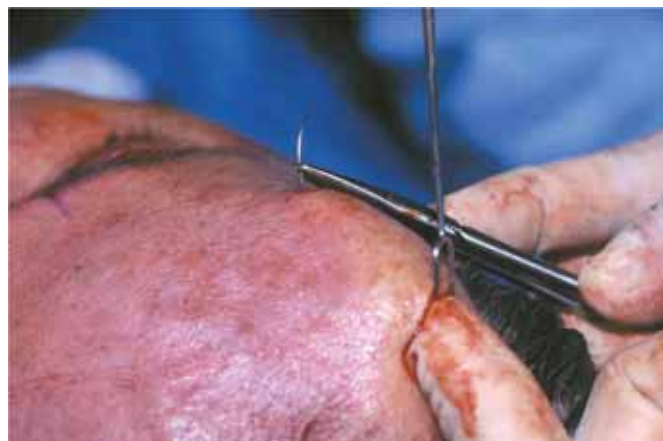
Fig. 3. Sutura de "ida y vuelta" para elevar las cejas. a) Esquema del procedimiento. b) Control "digital" para la extracción de la aguja.

La disección subperióstica de la región frontal representa un plano limpio, que nos permite elevar las cejas o tratar los músculos de la región fronto-orbitaria, ya sea por la vía superior descrita, a través de la vía transpalpebral o combinando ambas.