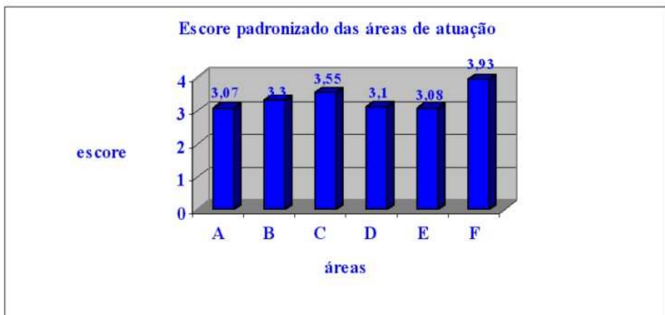
Gráfico 1: Distribuição dos escores padronizados das áreas de atuação dos enfermeiros de unidade aberta . São Paulo, 2002.