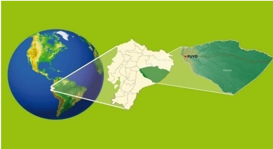
Gráfico 1. Ubicación espacial de la zona en estudio, provincia de Pastaza

Con tal propósito la investigación se divide en dos momentos: el estudio de perfil de clientes actuales de la provincia y el análisis de las relaciones entre los actores que intervienen.