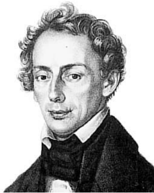
Figura 1. Christian Johann Doppler (1842)

En 1842, el ilustre matemático y físico austríaco Christian Johann Doppler ( figura 1 ), estableció la relación entre la velocidad de un objeto en movimiento y el cambio de frecuencia que produce al reflejar una onda en función de la frecuencia emitida, la velocidad del objeto y el coseno del ángulo de incidencia; de esta forma, si se dispone de un emisor estático que emite una onda a frecuencia conocida, que se refleja en un objeto en movimiento, puede calcularse fácilmente la velocidad del objeto. 1 En medicina, ello permite utilizar el ultrasonido para medir la velocidad del torrente sanguíneo en movimiento, mediante transductores que emiten y reciben ondas con frecuencia conocida.