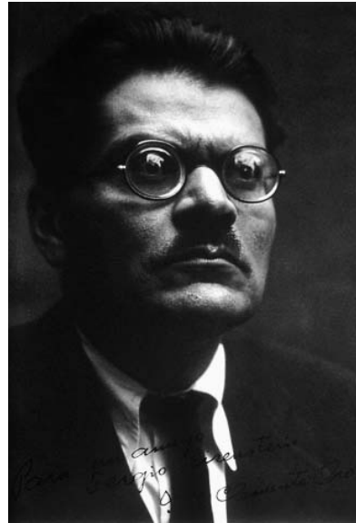
6. Retrato de José Clemente Orozco por Edward Weston, enviado por aquél a Eisenstein.