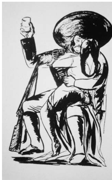
5. Otro de los grabados que impresionaron a Eisenstein. Museo de Eisenstein, Moscú.

teró seguramente a través de la radio, de la prensa o de la publicidad de dicha exposición. Lo buscó y platicaron de su proyecto de una posible película sobre México. Más que la plática con Diego Rivera, tal vez una llamada telefónica a Upton Sinclair, quien le informara que los problemas estaban resueltos, ya que gracias a la intervención del senador Borah el Departamento del Trabajo otorgó una prórroga hasta el 30 de noviembre, lo decidió a perder el barco para regresar a Los Ángeles y proseguir sus preparativos para su Mexican picture .