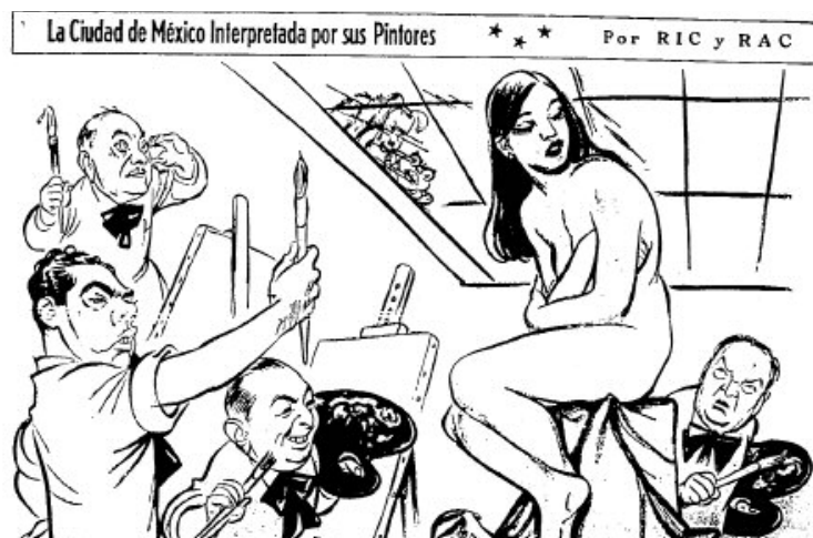
9. Ric y Rac, "La ciudad de México interpretada por sus pintores", Excelsior , 11 de diciembre de 1949, 2ª sección, p. 1.

En una comunicación que tuve con Chávez Morado 50 le pregunté lo que significaba la mujer como paisaje en su obra. Él respondió: "algo que amar y respetar". Probablemente había olvidado lo que él le hizo a La ciudad cuando la pintó en 1949. Quizá para el artista, esta mujer-ciudad fenómeno era un signo de advertencia; ella, como la modelo desnuda de la caricatura, aleja su mirada de los efectos devastadores que la industrialización, la corrupción y el abuso de poder le han causado. ¿Indiferencia o rechazo? A este gesto volveré más tarde.