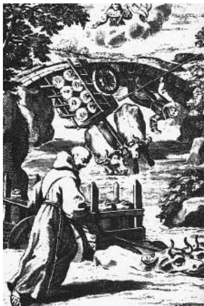
3. Sebastián de Aparicio, “el de las carreteras”, tomado de Vida prodigiosa del venerable siervo de Dios... , op. cit. (vid supra n. 18), p. 104.

La misma fuente continúa diciendo que Aparicio pasó de Puebla a México “aplicando desde aquí su singular industria, sin perdonar trabajo ni fatiga a descubrir camino proporcionado para el tránsito cómodo de las carretas dichas, abrió el que en el día se usa de esta ciudad al célebre Real de Minas de Zacatecas”. Estas carretas no sólo tuvieron carácter utilitario, ya que fueron también en “este Nuevo Mundo un eremitorio volante en cada una de aquellas en el mismo venerable se conducía” (fig. 3). 19