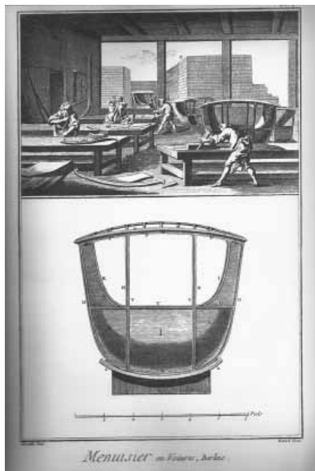
6. Taller de carrocería, L'Encyclopédie de Diderot y D'Alambert, París, s.e., 1751-1772.

cían que correspondía a los carpinteros de lo prieto realizar, entre otras cosas, “carretas”. 38 No obstante, en 1690 los carpinteros de lo prieto pidieron al ayuntamiento la creación de un gremio de maestros de hacer coches con las mismas ordenanzas que el de Madrid. Esgrimían que la falta de regulación ocasionaba “grave daño, perjuicio y fraude en las obras que se hacían”. Sin embargo, ello fue contestado por los correeros, ya que su gremio “siempre había estado en posesión de hacer todo género de guarnecidos de coches”, mientras que los carpinteros de lo prieto sólo se habían ocupado de “hacer las cajas de los coches y demás que toca a la madera”. De toda la farragosa prosa procesal que generó el pleito, destaca el proyecto de ordenanzas que los maestros de hacer coches sevillanos plantearon en 1698. El proceso concluyó en 1703, cuando fue aprobado el gremio hispalense, el cual se rigió por las ordenanzas de la capital de