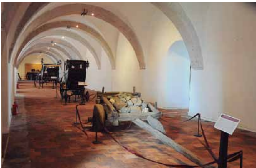
1. Carreta de minas, siglo XIX. Museo Regional de Guadalupe, Zacatecas.

Contamos con datos sobre los antecedentes de tal actividad en Puebla de los Ángeles. Una recopilación documental del siglo XVIII recoge normas de los virreyes Antonio de Mendoza y Luis de Velasco sobre las “personas que hacen en esta ciudad carretas” y los “oficiales de carpinteros [...] que labran y tratan en carretas”. 12