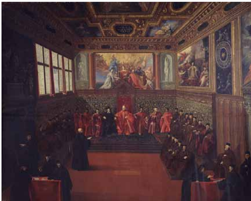
9. Pietro Malombra, La Sala del Colegio de Venecia, ca. 1606-1618, óleo sobre lienzo, 170 × 214 cm.

(fig. 9). Malombra era un especialista de escenas interiores. 20 En este lienzo representó la recepción de un embajador por parte del dux Leonardo Donato, probablemente al español Alonso de la Cueva, embajador en Venecia en 1606. Según Ridolfi, Malombra fue el primero en representar la Sala del Colegio en el Palazzo Ducale, con los grandes lienzos de Veronés, al fondo, y Tintoretto a la derecha. El tema de la representación de la Sala del Colegio lo retomaron otros artistas como Odoardo Fialetti, en un lienzo casi igual conservado en Hampton Court, pero en el que el dux recibe a sir Henry Wotton, embajador de Inglaterra; y El Greco, en un lienzo en una colección privada londinen-